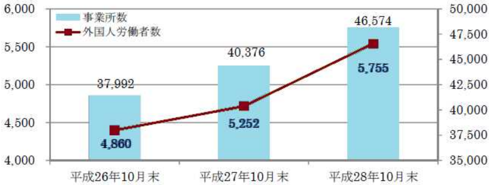
外国人雇用事業所数及び外国人労働者数の推移